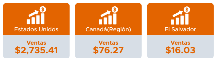
Cifras en millones de dólares estadounidenses.

Los países que fueron el principal destino de estas ventas fueron Estados Unidos, Canadá y El Salvador.